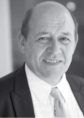
JEAN-YVES LE DRIAN

Président du Conseil régional de Bretagne