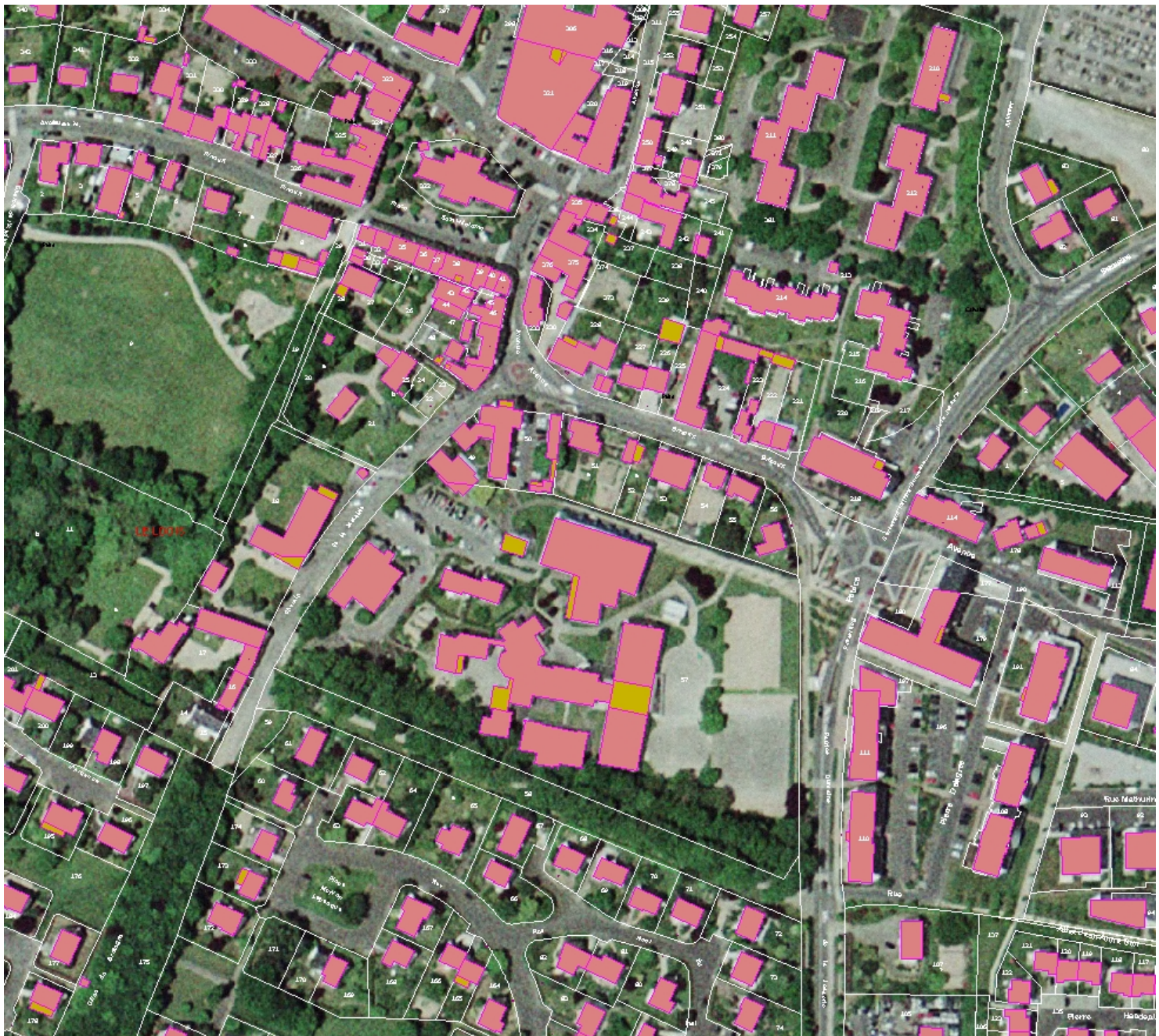
Echelle : 1/2 000