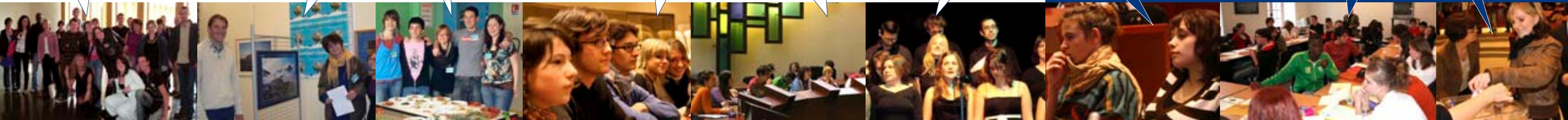
Démocratie au sein du CRJ.